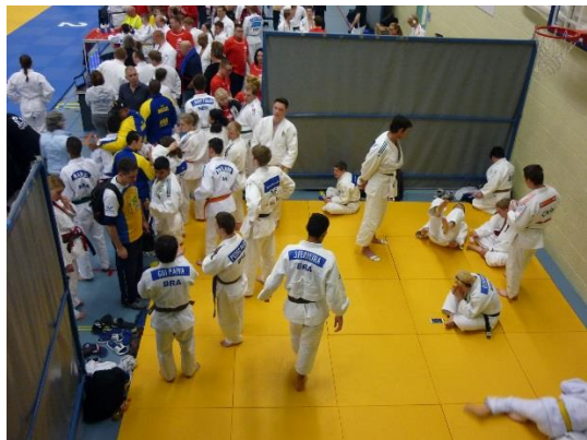
試合前の準備室。SO ロス大会に比べればやや狭い。