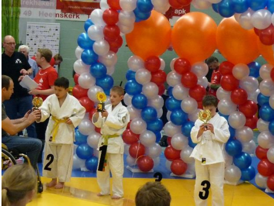
風船でかたどられた表彰台。