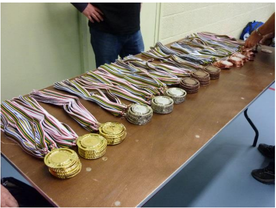
4~5名のリーグ形式で試合が行なわれ、1位、2位、3位その他、参加者全員にメダルが贈られるのはS0と同じ。