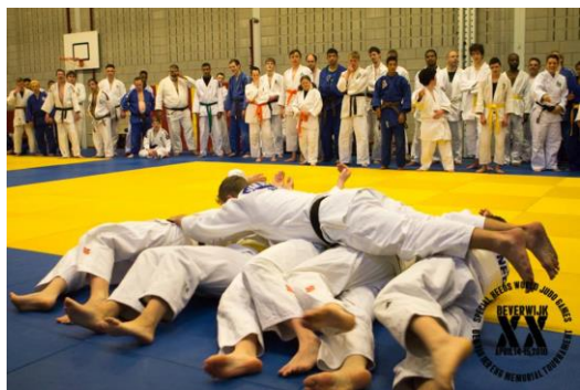
下で横になっている人がみんなで転がって上の人を移動させる。