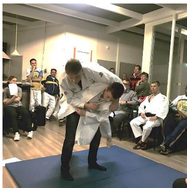
コーチ、審判が集められ、実演で説明された。