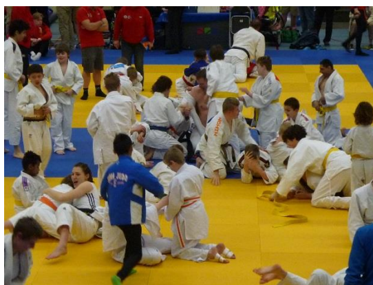
合同練習のようす。