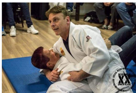
けさ固めでは、手を頸に回してはいけない。