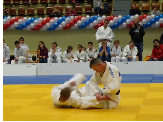
寝技による形もあり、採点基準はまだ統一したものはなさそうである。