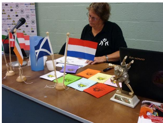
アスリートに渡される参加証。色分けされて自分の試合場が分かるようになっている。