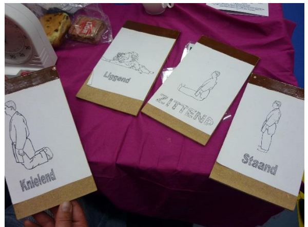
どのポジションから始めるのかを知らせるカード。