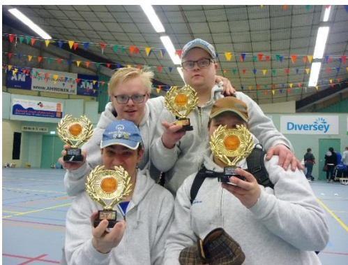
表彰後、トロフィーを自慢するアスリートたち。(フィンランドのチーム)