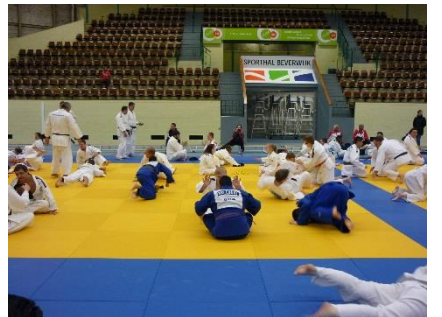
向かい合って組み合い、帯を取ったほうが勝ち。