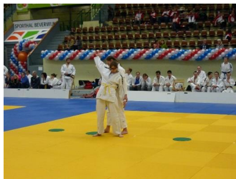
立ち位置を示すシートを置く組もあった。