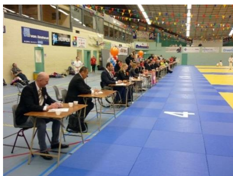
会場に並んで審査する審査員