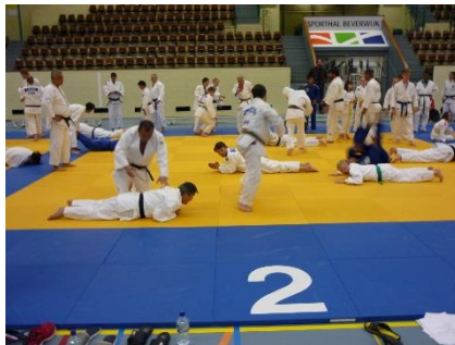
寝返りして逃げる相手を引き寄せて返す。