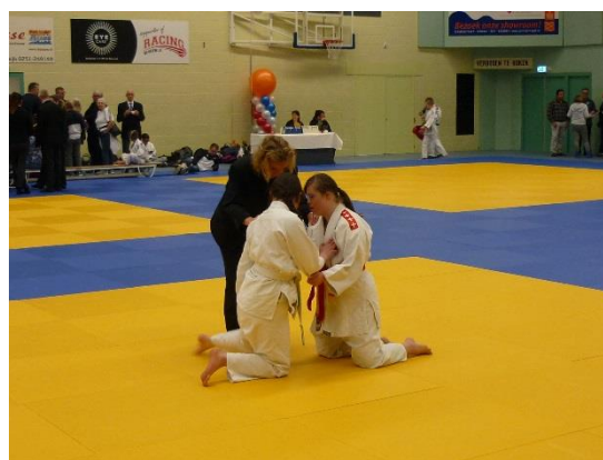
車いすの参加者も 10 名近くいて、寝技から始まる試合も多く見られた。