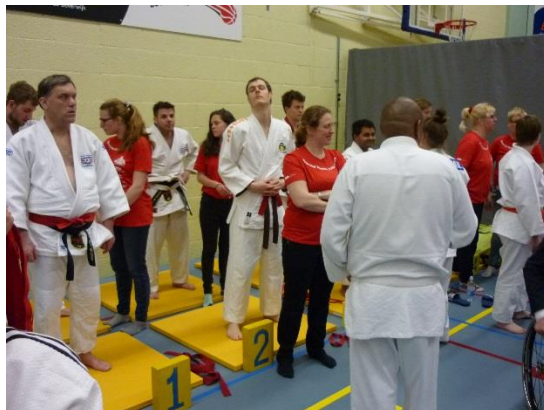
試合に出る前に、一旦ここに集められ、順番を待つ。