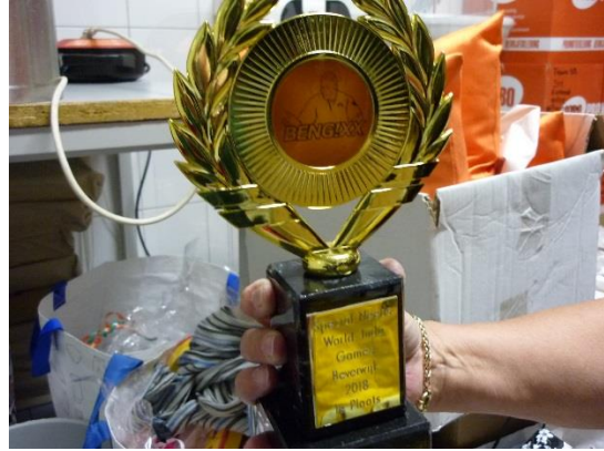
2日目のトロフィー。順位によって大きさが違う。すべての人がもらえる。