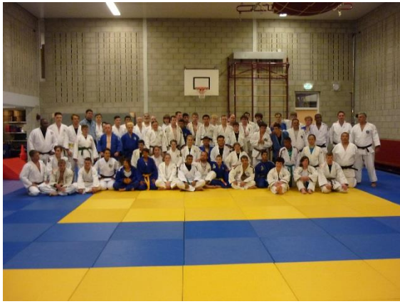
4月11日、3つ目のクラス で全体写真。