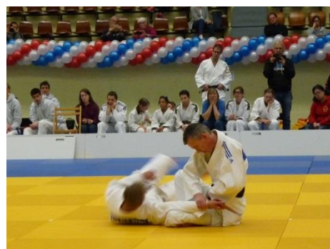
あぐらで向き合っを行なう独自の形もあった。