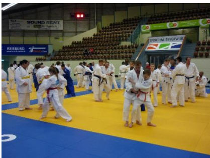
大腰のような体勢から、お互いが腰を前に突き出すのを競う。