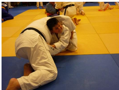
相手の帯を取ったほうが勝ち、という寝技のゲーム。