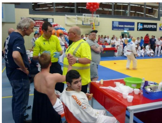
医療班。数名運ばれたが、打ち身程度で、大会中大きな事故はなかった。