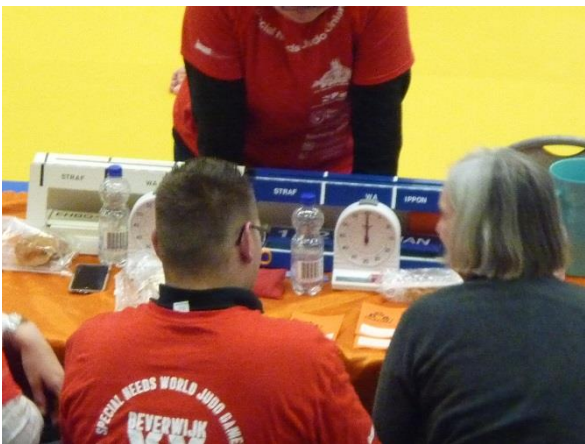
各試合場のスタッフ席。スコアボードとタイマー、右のようなカードが備えられている。