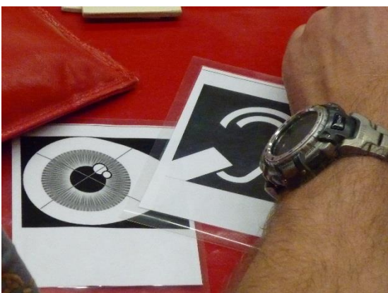
視覚障害や聴覚障害があり配慮が必要であることを審判に知らせるカード。