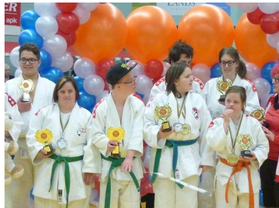
2日目の大会ではメダルではなく、トロフィーが贈られた。