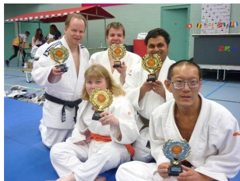
同じくトロフィーを持って記念撮影。(ブラジルのチーム)