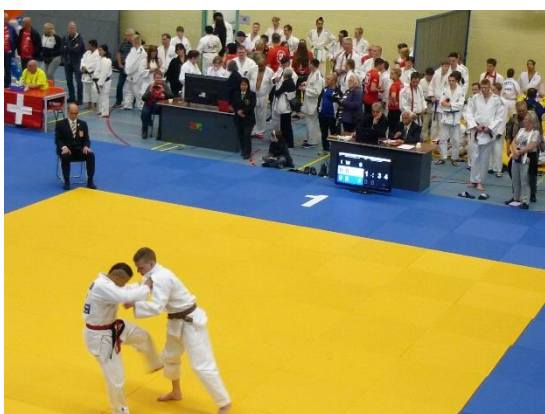
試合のようすと準備する参加者