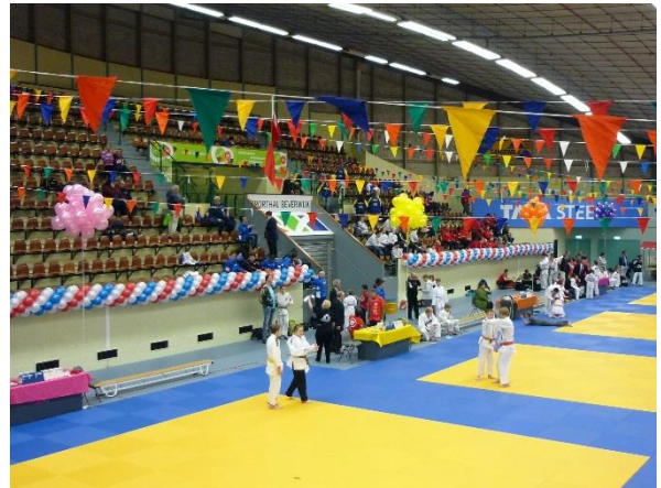
テーブルに色の違う風船が設置されている。