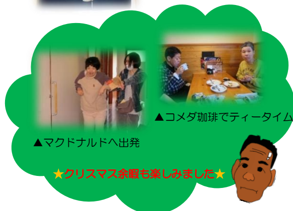
▲コメダ珈琲でティータイム