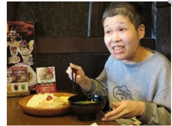
▲びっくりドンキー

短時間のレクが多かったですが、それでも美味しい食事とリラックスした時間を心行くまで堪能しました。