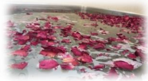
◆イベント入浴にて